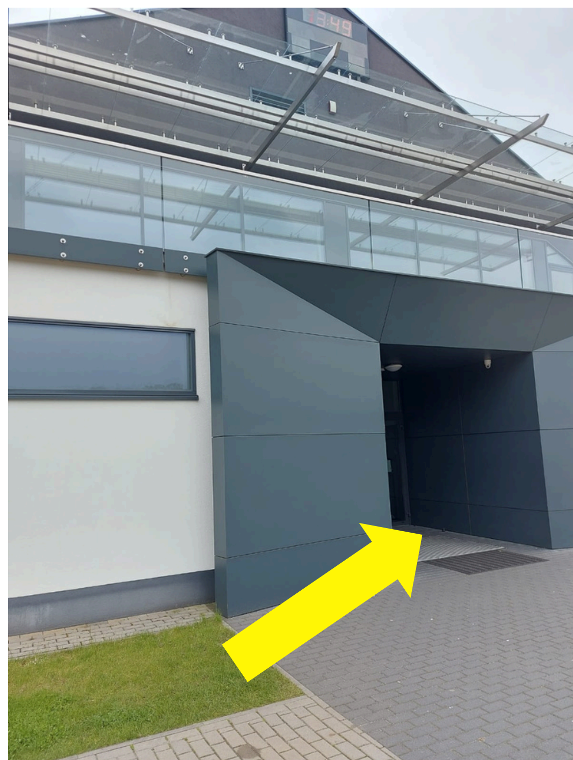
Przedmiot najmu nr 3