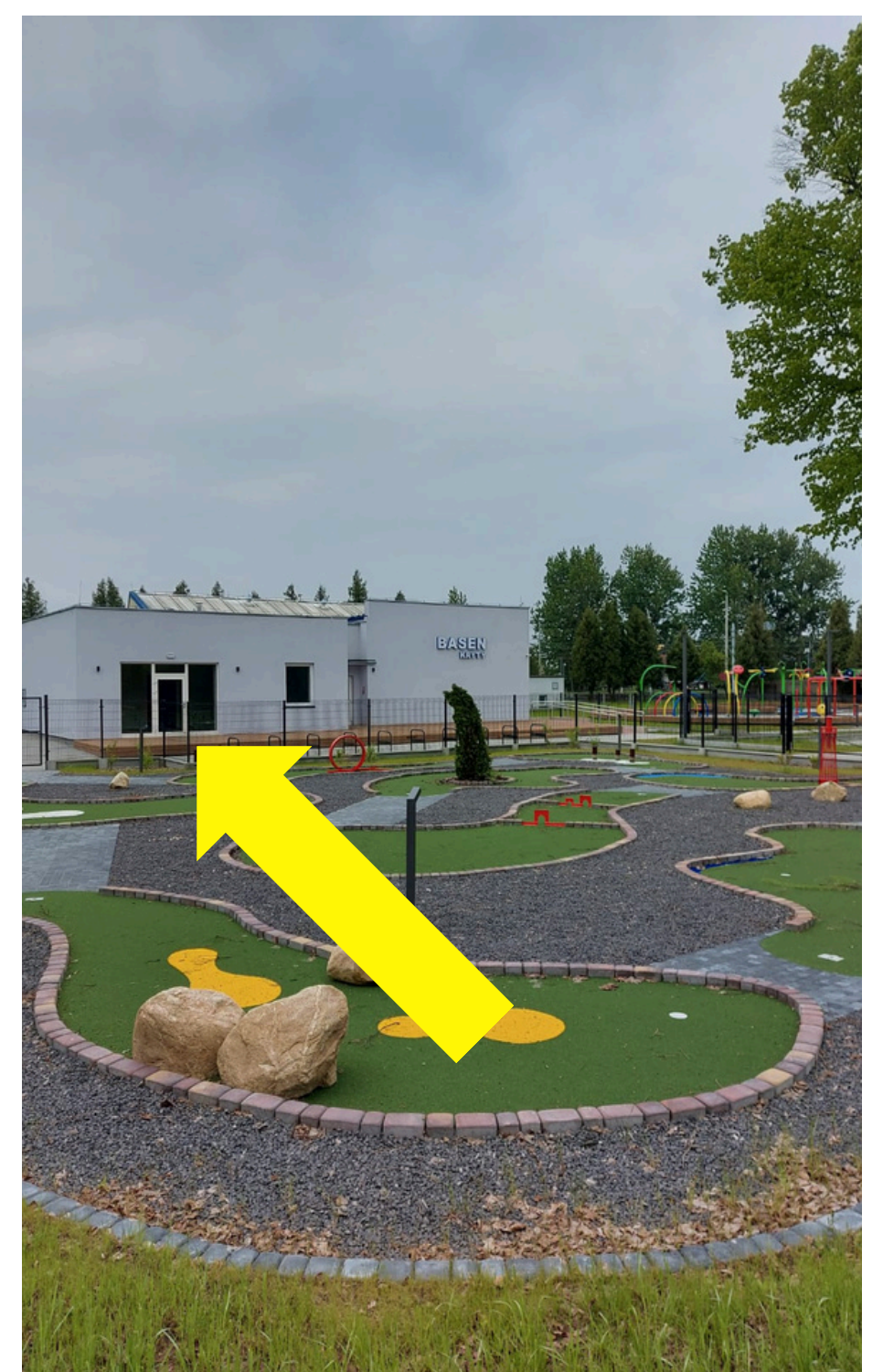
Przedmiot najmu nr 1, 2 - proponowana lokalizacja